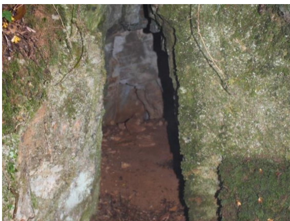
17. Trace de roue de chariot dans la roche – forêt communale